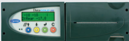
250 R para instalación en cabina.