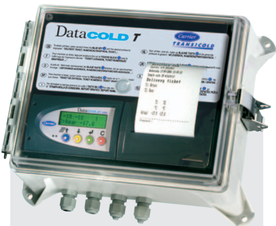
250 T para instalación exterior.

DataCOLD 250 se presenta en dos versiones: T para instalación exterior en el remolque y R para instalación en el interior de la cabina.