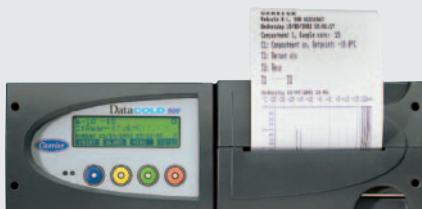
500 R para instalación en cabina.