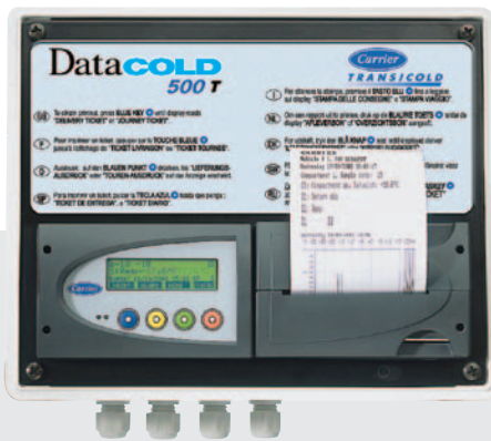
500 T para instalación exterior.